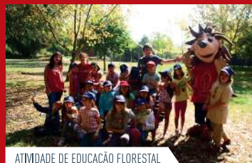
ATIVIDADE DE EDUCAÇÃO FLORESTAL