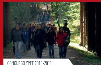
CONCURSO YPEF 2010-2011