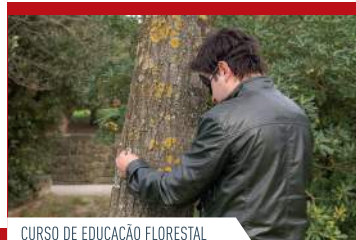
CURSO DE EDUCAÇÃO FLORESTAL

Integrados no Centro Regional de Excelência da Área Metropolitana do Porto (CRE_PORTO) participamos no projeto Futuro, no qual os cidadãos recebem formação sobre a importância da floresta urbana através de ações de formação, recolhas de sementes, plantações e reflorestações com espécies florestais autóctones.